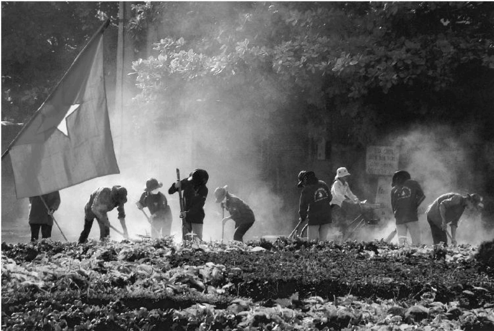
Thanh niên học sinh tham gia hoạt động bảo vệ môi trường.

- Bảo vệ và sử dụng tiết kiệm tài nguyên thiên nhiên : bảo vệ nguồn nước, bảo vệ các giống loài động, thực vật ; không đốt phá rừng, khai thác khoáng sản một cách bừa bãi ; không dùng chất nổ, điện,... để đánh bắt thủy, hải sản ; không tham gia vào các hành vi vận chuyển, mua bán động vật quý hiếm.