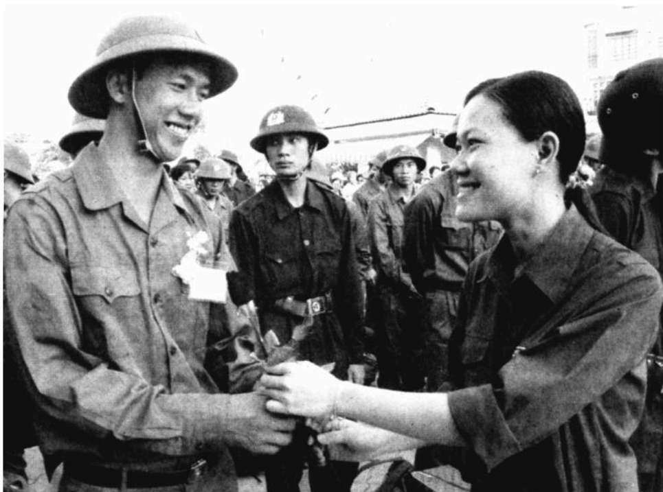
Thanh niên lên đường làm nghĩa vụ bảo vệ Tổ quốc.

Là những công dân trẻ tuổi yêu nước, thanh niên học sinh chúng ta có trách nhiệm :