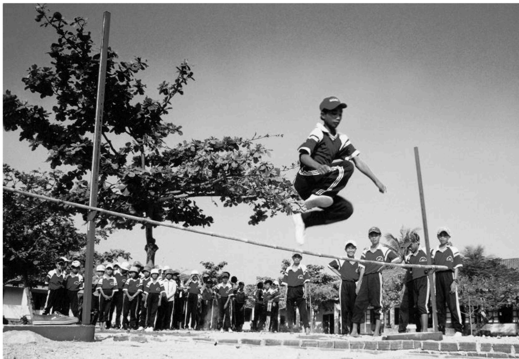
Tích cực rèn luyện thân thể.

– Vận động bạn bè, người thân thực hiện tốt nghĩa vụ bảo vệ Tổ quốc.