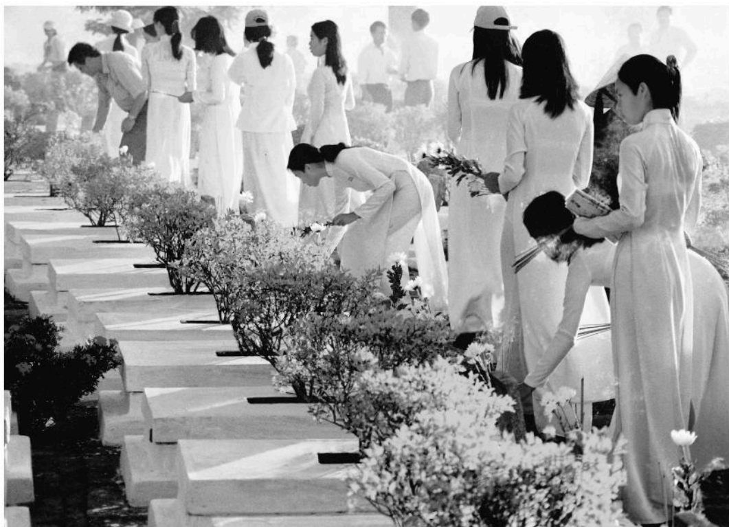
Thanh niên học sinh thăm viếng nghĩa trang liệt sĩ.