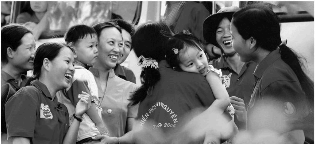
Thanh niên tình nguyện – đi dân nhớ, ở dân thương.

– Tích cực tham gia các hoạt động tập thể, hoạt động xã hội do nhà trường, địa phương tổ chức ; đồng thời vận động bạn bè và mọi người cùng tham gia.