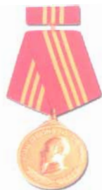
HUÂN CHƯƠNG HỒ CHÍ MINH