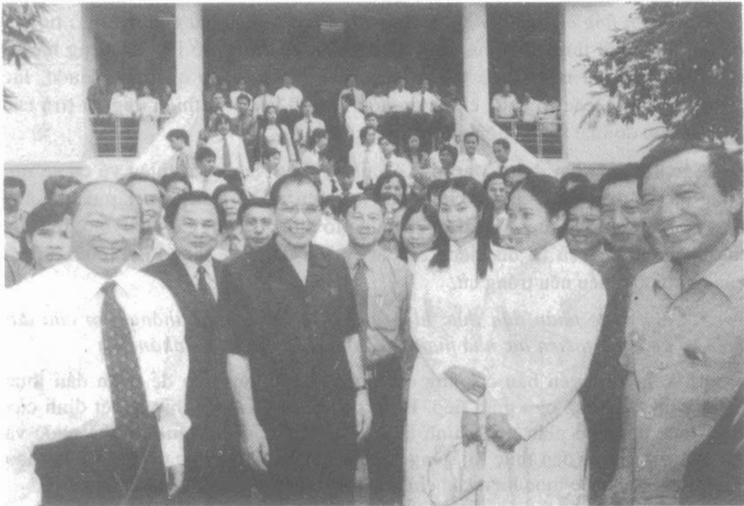
Tổng Bí thư Nông Đức Mạnh tiếp xúc cử tri các trường tại Từ Liêm, Hà Nội.