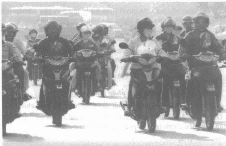
Người đi xe máy đội mũ bảo hiểm.