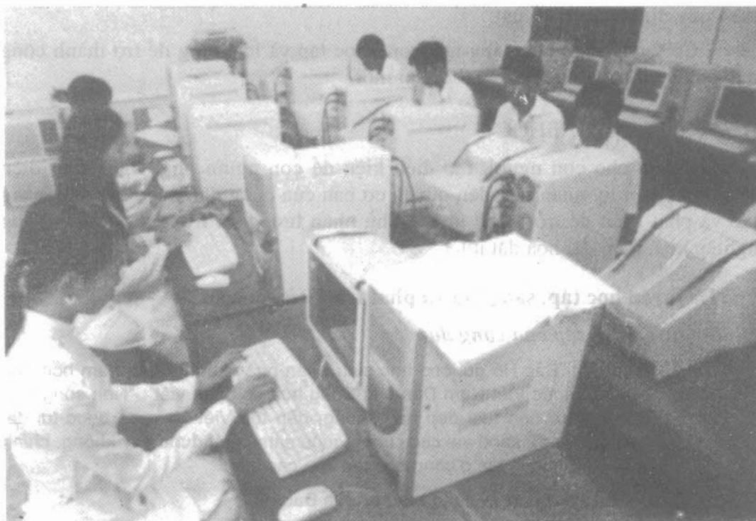
Lớp học vi tính ở Trường Trung học phổ thông Hoàng Diệu, tỉnh Sóc Trăng.

Em dự định sẽ tiếp tục thực hiện quyền học tập của mình như thế nào sau khi tốt nghiệp trung học phổ thông ?