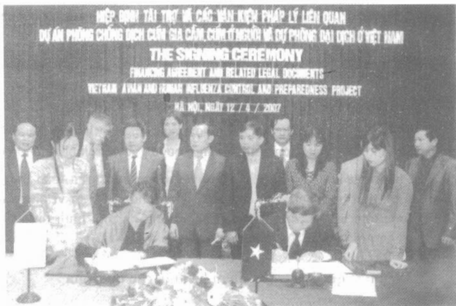
Lễ kí kết hiệp định tài trợ Dự án phòng chống dịch cúm gia cầm, cúm ở người và dự phòng đại dịch ở Việt Nam.