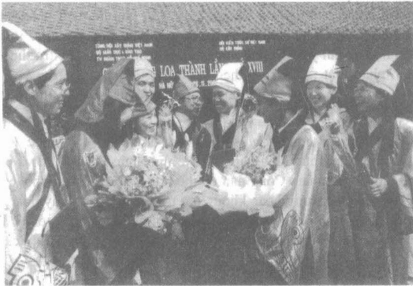
Sinh viên được nhận giải thưởng Loa Thành về thành tích sáng tạo trong nghiên cứu khoa học.