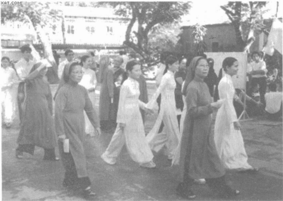
Nữ tu dòng Mến Thánh Giá ở Nhà thờ Phú Cam (Huế) đi bỏ phiếu trong cuộc bầu cử Quốc hội tháng 5 năm 2007.